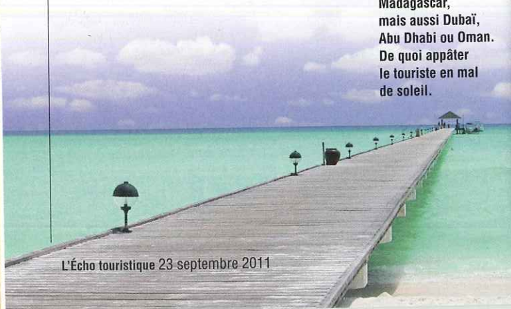
L'Écho touristique 23 septembre 2011

De nombreuses offres d'hôtels haut de gamme dans la zone sont proposées en séjours simples ou combinés.